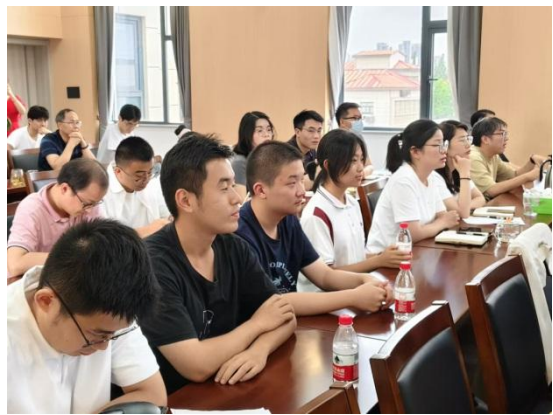
(图为学生代表旁听分享会)

为进一步深化政务公开成果，搭建学生认识审计、了解审计的平台，我局邀请了来自上海对外经贸大学、华东师范大学的大学生及来自宝山区行知中学、宝山区罗店中学的高中生学生代表参加本次活动。活动包含了参观“聚菁荟审”党建阵地、旁听审计工作成果交流分享会、体验审计现场等环节。分享会上，项目主审介绍了我局聚焦民生改善和城市治理开展的审计项目经验，展示了通过审计监督促进各