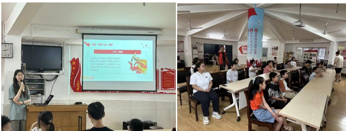
（图为突击队员开展审计宣讲）

走进民生，呵护民生温度。 我局派出青年强审突击队队员前往宝林六村开展“审计进社区”宣讲活动。突击队员将科技发展科普和儿童安全教育等话题与审计工作巧妙融合，通过趣味有奖问答等寓教于乐的方式，让社区孩子们在思维碰撞中吸收知识，充实暑期生活。活动现场气氛热烈，孩子们与突击队员积极互动，宣讲结束后意犹未尽，纷纷表示收获很多。这次活动深入群众，让群众切实感受审计机关的为民情怀。