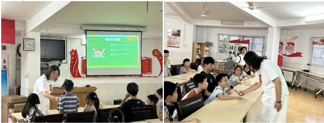
(图为宣讲互动环节)