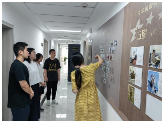
(图为学生代表参观党建阵地)